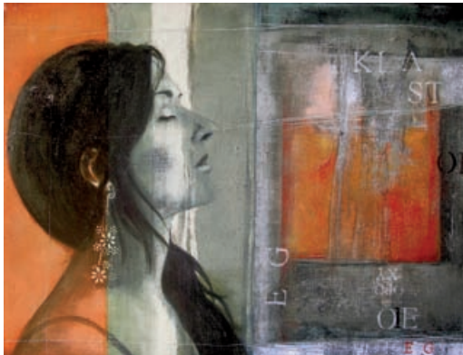
Erick Gonzalez Mixte, sans titre (65 x 50 cm)

Parkings gratuits : 27 rue des Abondances (souterrain) - 20 quai du 4 septembre (extérieur)