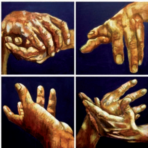
Erick Gonzalez " Mains " Combine Painting (160 x 160 cm)